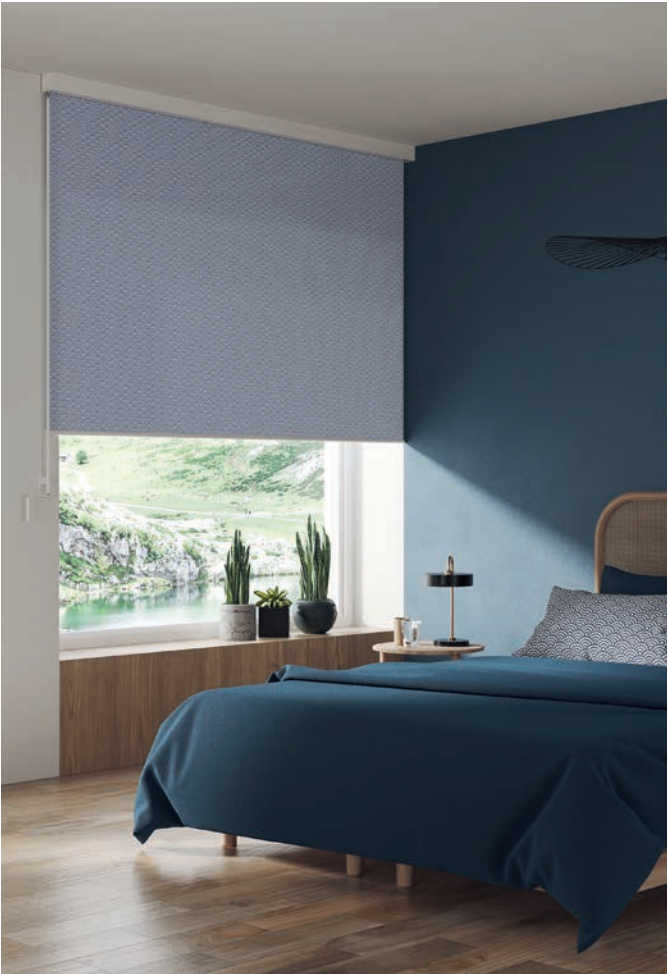
R_03 Kassette, Behang HARO 2-2545

Unsere Rollo_Produktfamilie bietet die ideale Lösung für individuellen Anforderungen. Ob für das Büro, den Wohnbereich oder spezielle Anwendungen – unsere Produktvielfalt ermöglicht es, unterschiedlichsten Bedürfnissen gerecht zu werden. Geniessen Sie massgeschneiderte Funktionalität.