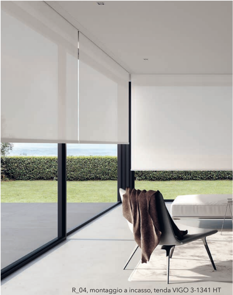
R_04, montaggio a incasso, tenda VIGO 3-1341 HT