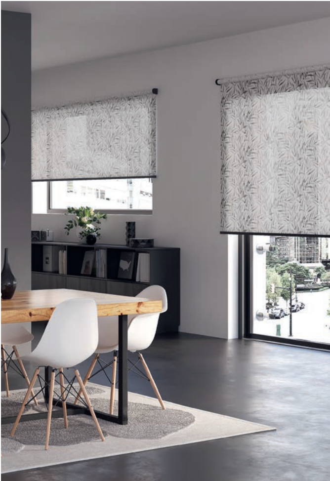
Supporto R_03, tenda SEVILO 3-2358

Venite a scoprire la flessibilità della nostra famiglia di tende a rullo con opzioni di montaggio variabili. A parete, a soffitto, all'interno della nicchia della finestra o con un elegante montaggio a incasso: le nostre tende a rullo si adattano perfettamente ai vostri ambienti interni, offrendo soluzioni versatili per una progettazione personalizzata degli ambienti.