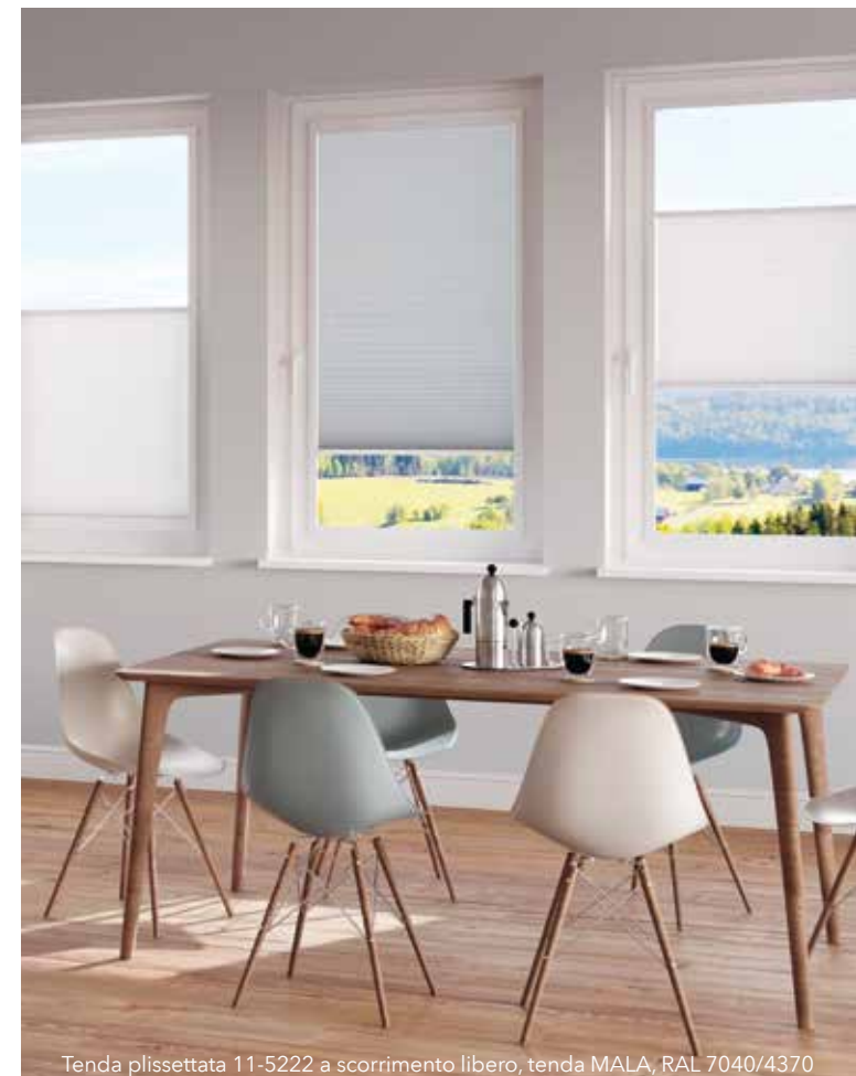
Tenda plissettata 11-5222 a scorrimento libero, tenda MALA, RAL 7040/4370