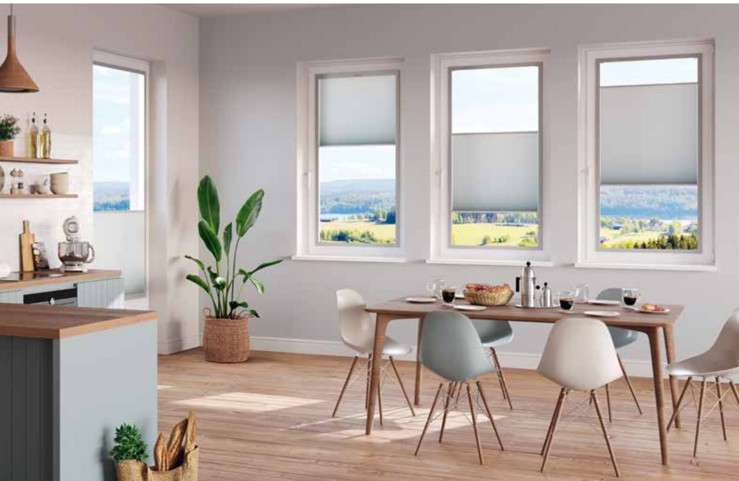
Plissettato a nido d'ape 11-5222 a scorrimento libero, tenda MALA, RAL 7040

L'efficienza energetica, il design moderno e le eccellenti opzioni di oscuramento fanno dei plissettati a nido d'ape DUETTE® un tipo di tenda particolarmente apprezzato. In combinazione con il telaio magnetico si ottiene una protezione visiva e solare di facile montaggio, che si integra con stile in ogni abitazione.